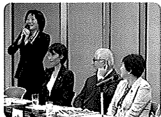
歯科医療についての懇談会

日本の安全保障と危機管理の問題は、今国会の重要なテーマです。自衛隊の方々や地元市ヶ谷の地域の方々との懇談の場で、ご挨拶をさせて頂きました。