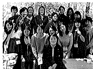
高校時代の同級生と

製薬業界から要望をお伺いしました。私は以前、製薬会社のMRの方々と一緒に働いたことがあります。医薬品産業の強化は日本の成長戦略の重要な課題です。