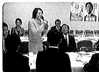
医薬品産業と成長戦略

トラック業界の要望を実現する会に出席しました。トラック流通は産業の血液。燃料高騰に負けないための対策について、全国からお話を伺いました。