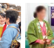
千代田区でお囃子体験