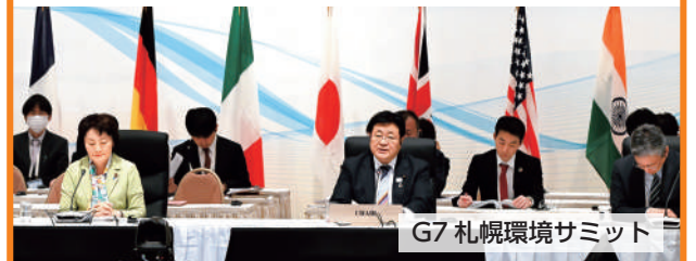
G7 札幌環境サミット