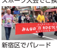
新宿区でパレード