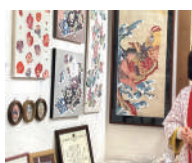
新宿区の伝統技術