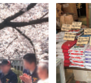
新宿区の米穀店で