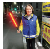
火の用心の夜回り