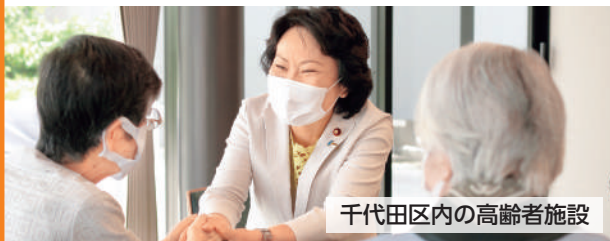
千代田区内の高齢者施設