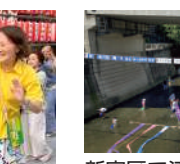
新宿区で江戸文化体験