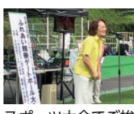
スポーツ大会でご挨拶