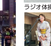
夏の縁日・盆踊り