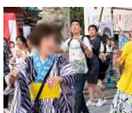
新宿区で江戸文化体験