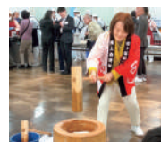
自衛隊駐屯地餅つき