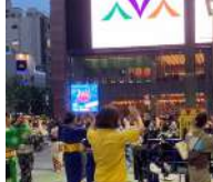
夏の縁日・盆踊り