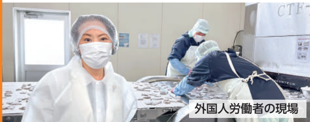
外国人労働者の現場