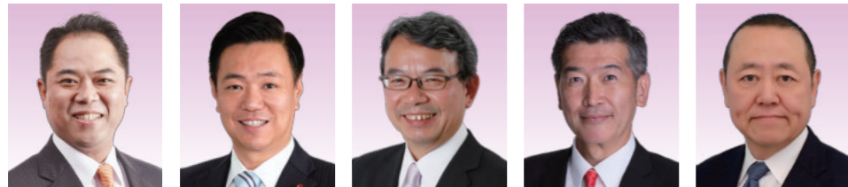
池田 ともりの 大坂 隆洋 角谷 幹夫 うがい 友義 かの としやす