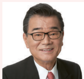
きたしろ勝彦 都議会議員