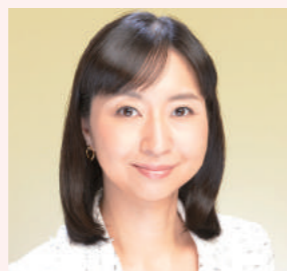
大門さちえ 都議会議員