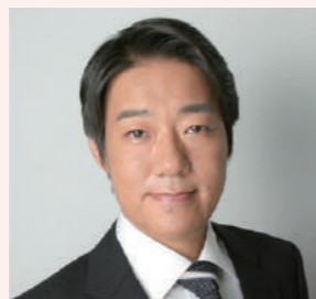
秋田一郎 都議会議員