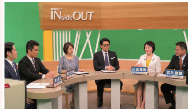
BS11『報道ライブINsideOUT』に出演。与野党の若手国会議員で白熱の議論となりました。

すっかり春らしくなりました。皆様にはお健やか にお過ごしのこととお慶び申し上げます。期待と不 安から始まった2017年も4月を迎え、いよいよ新年 度が始まります。